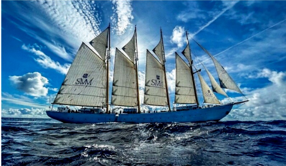
Splendide vele sul mare

Da domani un evento dedicato alla cultura del nostro mare come spazio condiviso tra i popoli